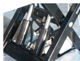
En eller två cylindrar = 1000 eller 2000/4000 kg.