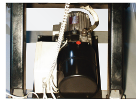
Pumpenhet med låg ljudnivå, med inbyggd överlast- och flödekomparerad ventil för kontrollerad sänkhastighet.