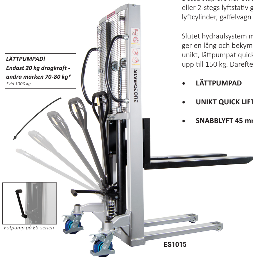
Fotpump på ES-serien

LÄTTPUMPAD! Endast 20 kg dragkraft - andra märken 70-80 kg* *vid 1000 kg